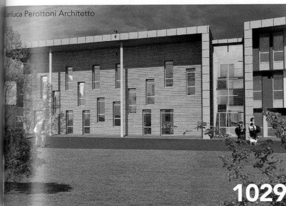
CAD E BIM